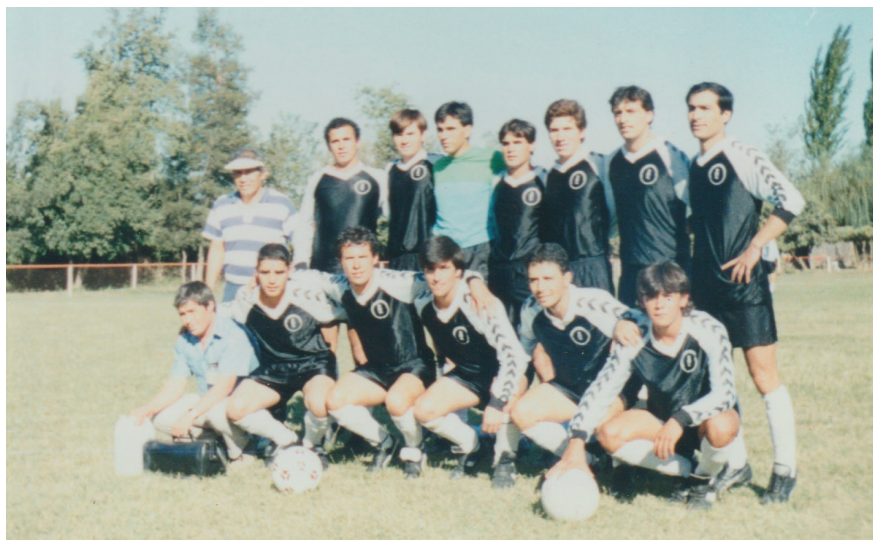
Club Deportivo Antártida