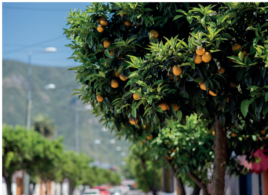
Av. A. Jaramillo. Naranjos de Nancagua

Cuentan los pobladores de Nancagua, que la festividad se terminó de forma abrupta y por razones de fuerza mayor. Un accidente, que terminó con una persona muerta y varios heridos, a