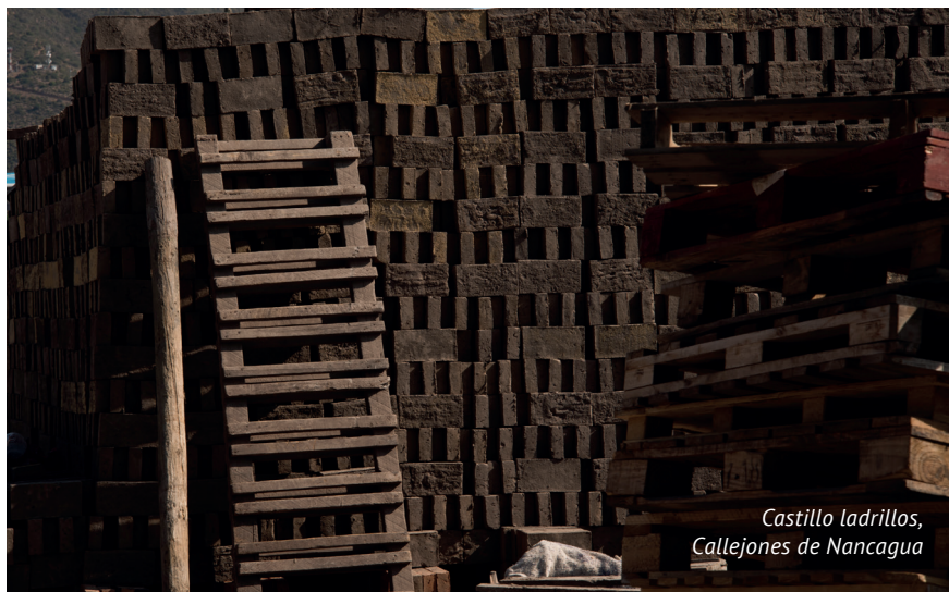
Castillo ladrillos, Callejones de Nancagua

primera tomada de higuera que hacía la gente, los que tenían higueras grandes, y bailaban, bailaban cueca debajo de las higueras, tocando guitarras, tocando acordeones”.