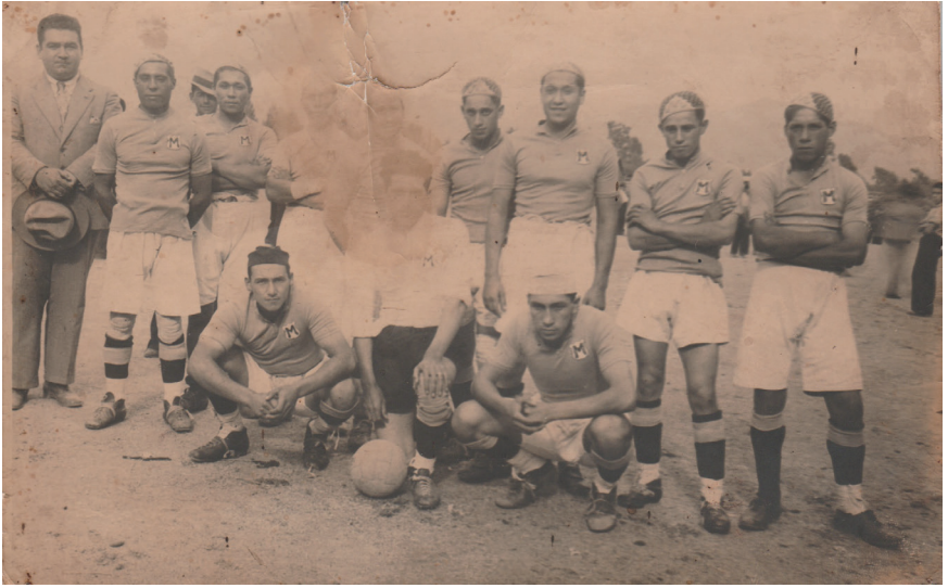
Club Deportivo Magallanes